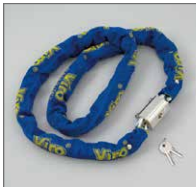
Catena semiquadra di sezione 8 mm in acciaio speciale al manganese, cementato e temprato, protetta da guaina in tessuto blu che minimizza l'ingombro