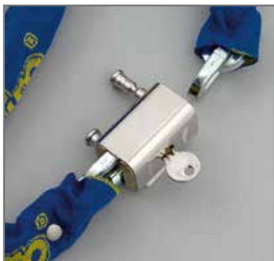
Due aste indipendenti e barilotto protetto contro lo strappo