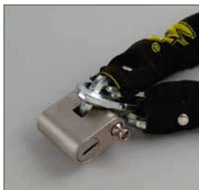
Catena esagonale di sezione 13 mm in acciaio speciale al manganese, cementato, temprato e zincato, protetta da guaina in tessuto nero che minimizza l'ingombro. Ultime anelle "a cappio"