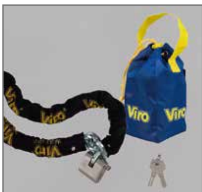
Dotati di pratica borsa da trasporto, in tela di nylon