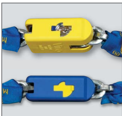
Barilotto protetto contro lo strappo ed il trapano. Protezione copri serratura, contro l'aggressione degli agenti atmosferici