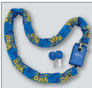
Catena quadra di sezione 7 mm. in acciaio speciale al manganese, fissata al Supermorsio con un perno in acciaio inox ribadito, e protetta da guaina in tessuto blu che minimizza l'ingombro