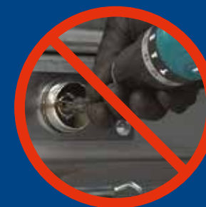
Defensa contra el taladro