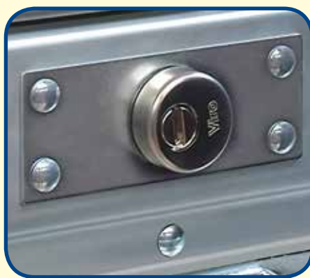
Plaquita externa de protección de acero zincado de espesor 2,5 mm