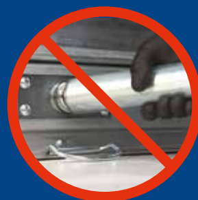
Resistente al forzamiento con tubo de andamio