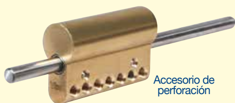
Accesorio de perforación