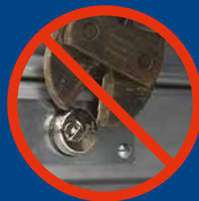
Protegida contra el desgarro

Realizado de acero cementado, templado, cobrizado y niquelado, con plaquita rotatoria de espesor 7 mm.